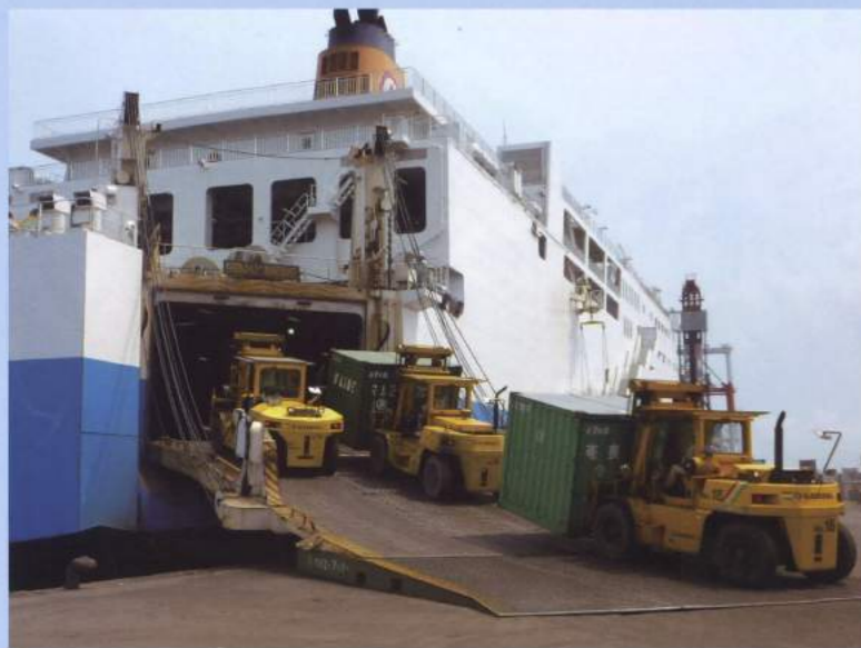
鹿児島から沖縄までの時刻表

毎日あるいは隔日出港のフェリーを利用して、奄美諸島を中心に全ての県内離島・沖縄全島について一般雑貨及び冷凍、冷蔵食品等様々な形態の貨物を取扱っています。奄美大島まで11時間、沖縄まで25時間で結びます。遠方へも荷物に応じたコンテナに収容するため、味覚や鮮度を落とさず確実に運び、又、料金も航空便に比べて経済的です。それ以外にも倉庫での保管から小口配送まで一貫輸送を展開しています。